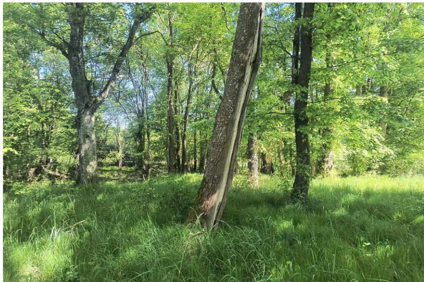
Widok od południowego - zachodu

7. Fotografia z opisem wskazującym orientację w stosunku do sąsiednich terenów lub stron świata albo mapa z zaznaczonym stanowiskiem archeologicznym