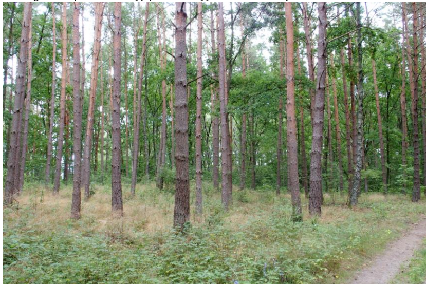
Widok od południowego - zachodu

7. Fotografia z opisem wskazującym orientację w stosunku do sąsiednich terenów lub stron świata albo mapa z zaznaczonym stanowiskiem archeologicznym