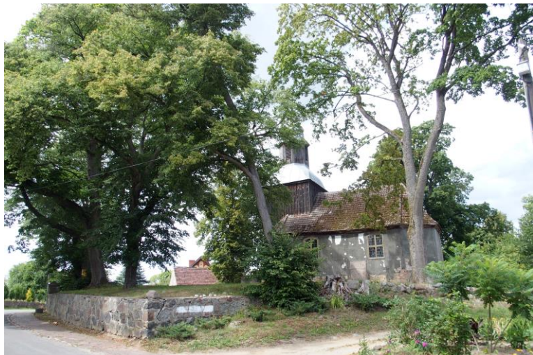
Widok od południowego - wschodu

7. Fotografia z opisem wskazującym orientację w stosunku do sąsiednich terenów lub stron świata albo mapa z zaznaczonym stanowiskiem archeologicznym