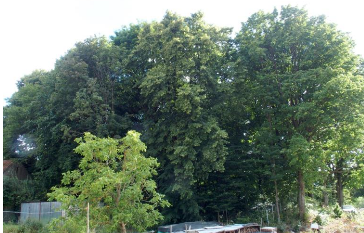
Widok od północnego - wschodu

7. Fotografia z opisem wskazującym orientację w stosunku do sąsiednich terenów lub stron świata albo mapa z zaznaczonym stanowiskiem archeologicznym