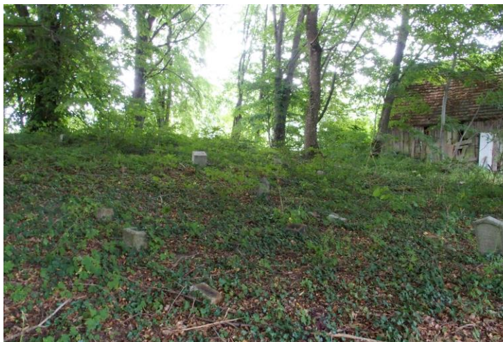
Widok od południowego - zachodu