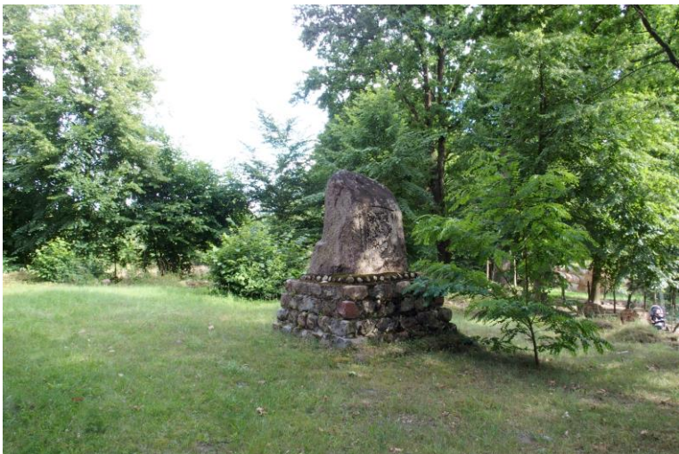
Widok od północnego - zachodu

7. Fotografia z opisem wskazującym orientację w stosunku do sąsiednich terenów lub stron świata albo mapa z zaznaczonym stanowiskiem archeologicznym