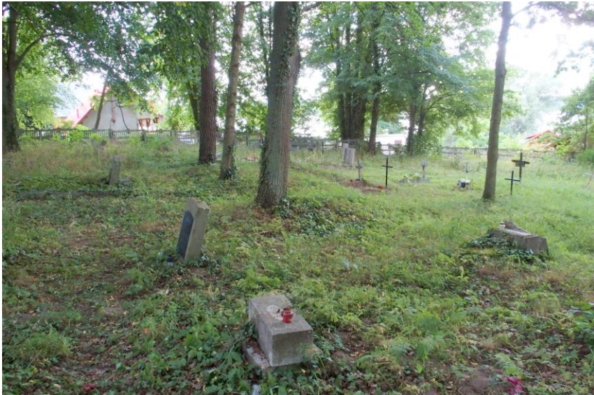
Widok od północnego - wschodu

7. Fotografia z opisem wskazującym orientację w stosunku do sąsiednich terenów lub stron świata albo mapa z zaznaczonym stanowiskiem archeologicznym