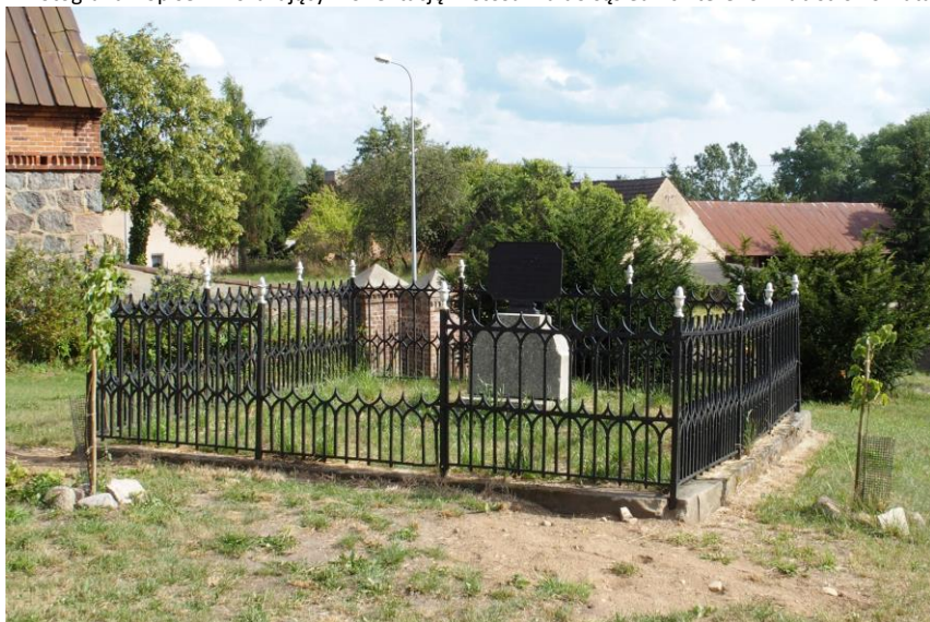
Widok od północnego - zachodu

7. Fotografia z opisem wskazującym orientację w stosunku do sąsiednich terenów lub stron świata albo mapa z zaznaczonym stanowiskiem archeologicznym