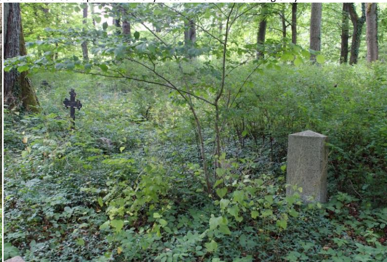
Widok od północnego - zachodu