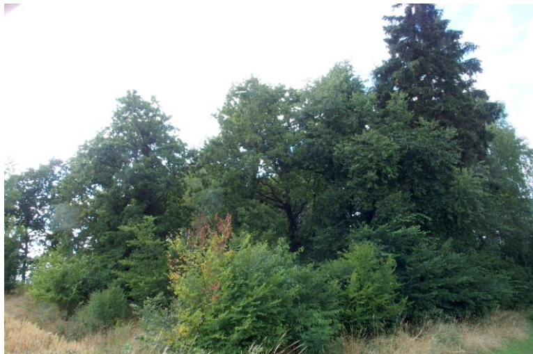
Widok od południowego - wschodu

7. Fotografia z opisem wskazującym orientację w stosunku do sąsiednich terenów lub stron świata albo mapa z zaznaczonym stanowiskiem archeologicznym