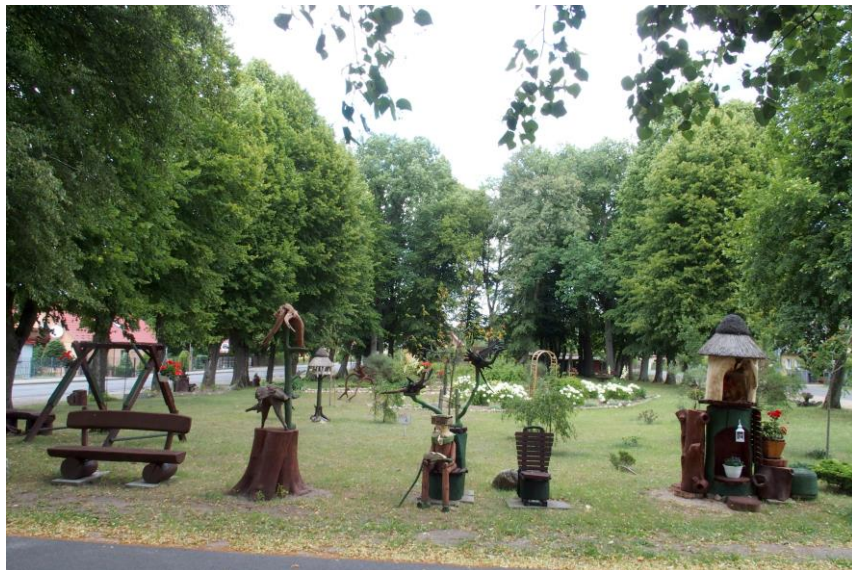
Widok od południowego - zachodu

7. Fotografia z opisem wskazującym orientację w stosunku do sąsiednich terenów lub stron świata albo mapa z zaznaczonym stanowiskiem archeologicznym