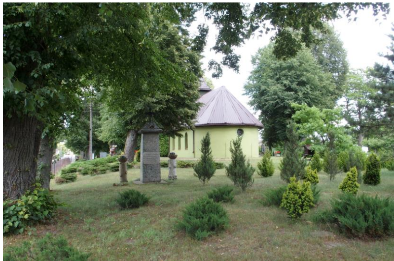
Widok od południowego - zachodu

7. Fotografia z opisem wskazującym orientację w stosunku do sąsiednich terenów lub stron świata albo mapa z zaznaczonym stanowiskiem archeologicznym