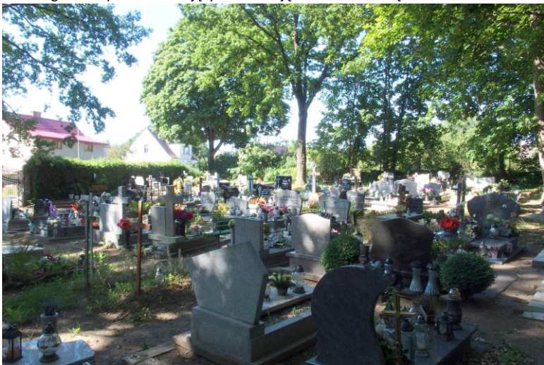
Widok od południowego - wschodu

7. Fotografia z opisem wskazującym orientację w stosunku do sąsiednich terenów lub stron świata albo mapa z zaznaczonym stanowiskiem archeologicznym