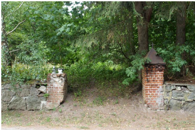
Widok od południowego - zachodu

7. Fotografia z opisem wskazującym orientację w stosunku do sąsiednich terenów lub stron świata albo mapa z zaznaczonym stanowiskiem archeologicznym