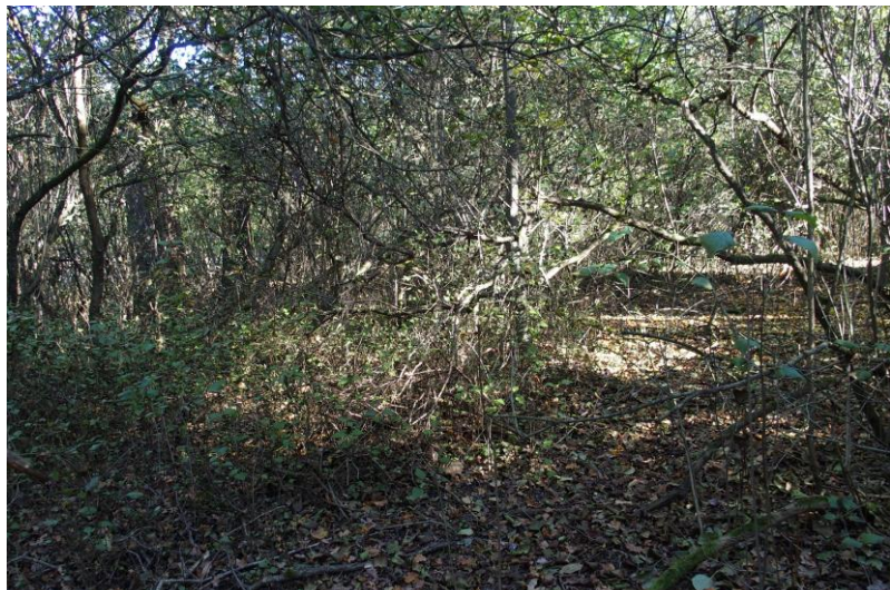
Widok od północnego - zachodu

7. Fotografia z opisem wskazującym orientację w stosunku do sąsiednich terenów lub stron świata albo mapa z zaznaczonym stanowiskiem archeologicznym