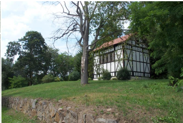
Widok od południowego - wschodu