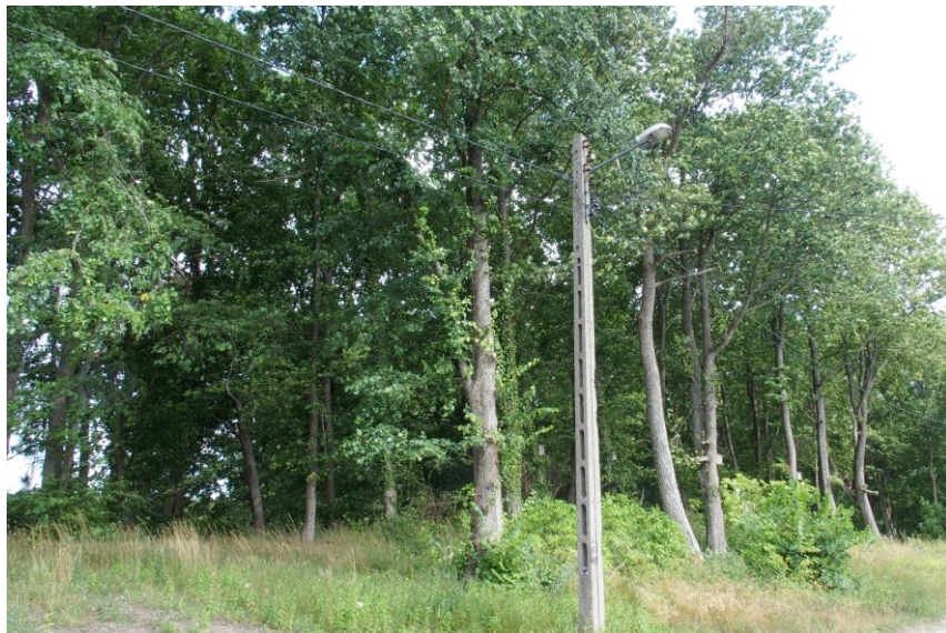
Widok od północnego - zachodu

7. Fotografia z opisem wskazującym orientację w stosunku do sąsiednich terenów lub stron świata albo mapa z zaznaczonym stanowiskiem archeologicznym