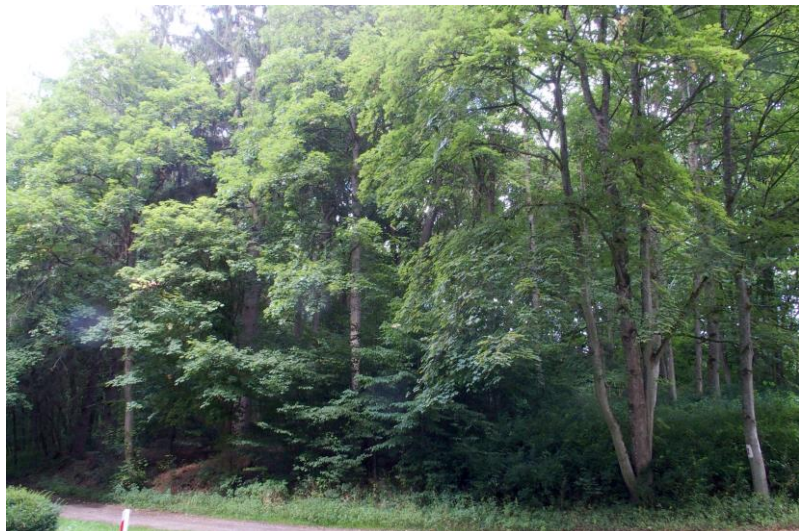
Widok od południowego - zachodu

7. Fotografia z opisem wskazującym orientację w stosunku do sąsiednich terenów lub stron świata albo mapa z zaznaczonym stanowiskiem archeologicznym