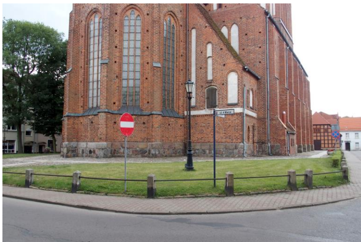
Widok od północnego - wschodu

Rady Miejskiej w Dąbsku Pomorskim z dnia 31.01.2008 r.