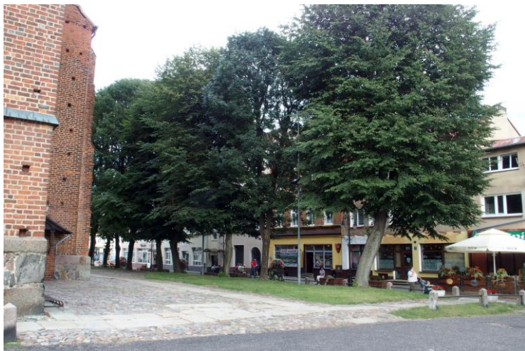
Widok od północnego - zachodu

7. Fotografia z opisem wskazującym orientację w stosunku do sąsiednich terenów lub stron świata albo mapa z zaznaczonym stanowiskiem archeologicznym