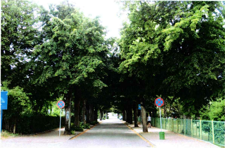
Widok od północnego - wschodu

7. Fotografia z opisem wskazującym orientację w stosunku do sąsiednich terenów lub stron świata albo mapa z zaznaczonym stanowiskiem archeologicznym