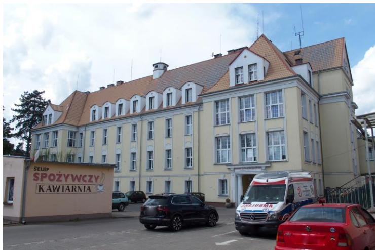
Widok budynku od południowego - wschodu

7. Fotografia z opisem wskazującym orientację w stosunku do sąsiednich terenów lub stron świata albo mapa z zaznaczonym stanowiskiem archeologicznym