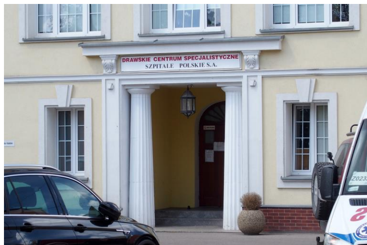
Widok od południowego - wschodu