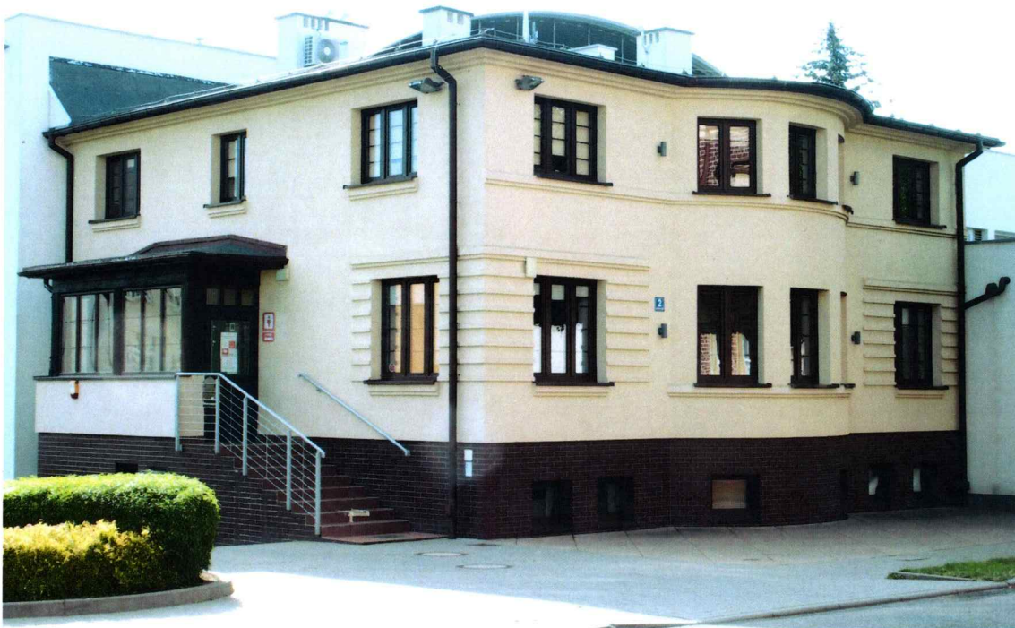
Widok budynku od wschodu

7. Fotografia z opisem wskazującym orientację w stosunku do sąsiednich terenów lub stron świata albo mapa z zaznaczonym stanowiskiem archeologicznym