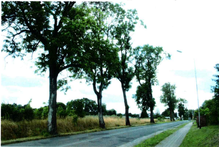
Widok od północnego - zachodu

7. Fotografia z opisem wskazującym orientację w stosunku do sąsiednich terenów lub stron świata albo mapa z zaznaczonym stanowiskiem archeologicznym