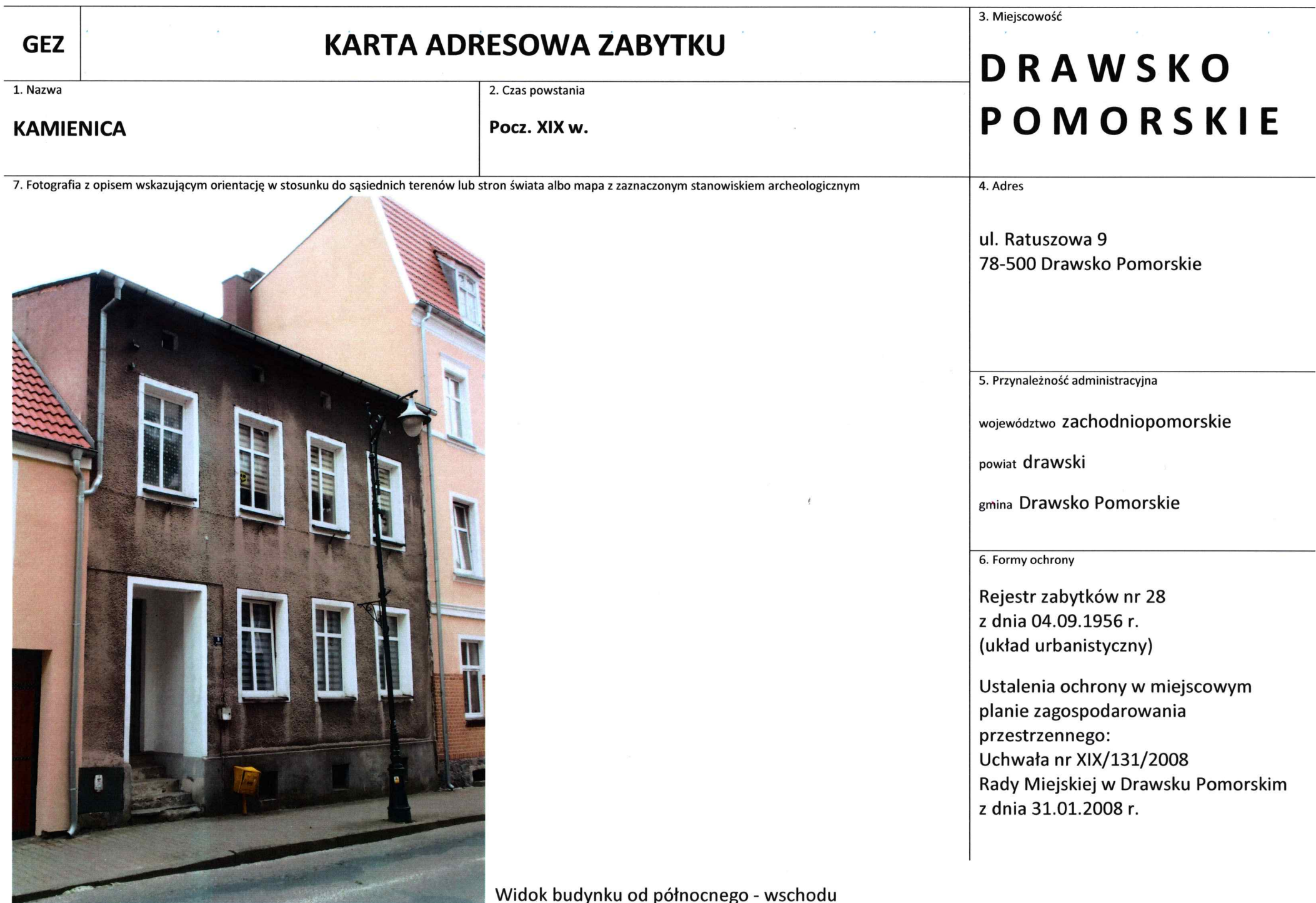
Widok budynku od północnego - wschodu